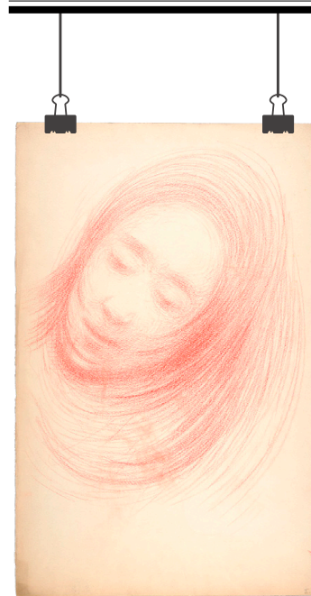
L'auréole (1900-1902) sanguine sur papier – 50,1 x 32,5 cm