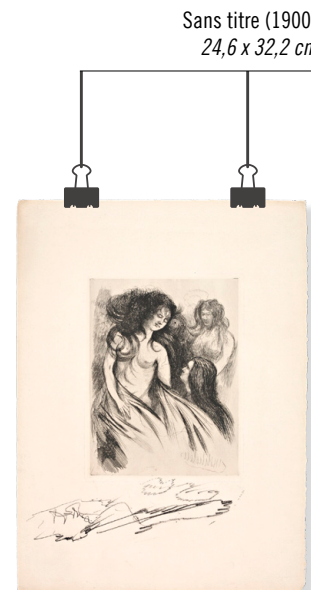
Sans titre (1900) 24,6 x 32,2 cm