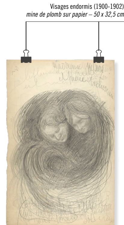
Visages endormis (1900-1902) mine de plomb sur papier – 50 x 32,5 cm